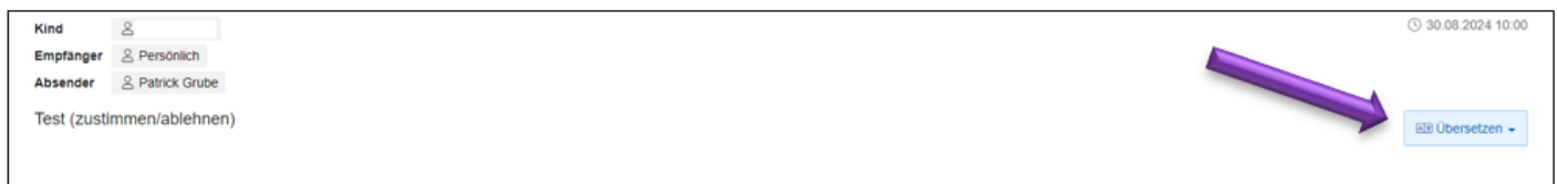
Abbildung 3: Übersetzen

Der Text des Elternbriefes kann in unterschiedliche Sprachen übersetzt werden. Dazu rechts auf den Knopf „übersetzen“ klicken und die entsprechende Sprache auswählen.