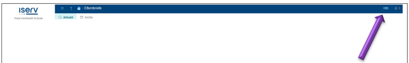
Abbildung 1: Hilfe Elternbriefmodul

Bei der Benutzung in IServ findet man oben die „Hilfe“. Diese Hilfe ist sehr ausführlich. Im folgenden Artikel werden nur ein paar zusätzliche Informationen geliefert.