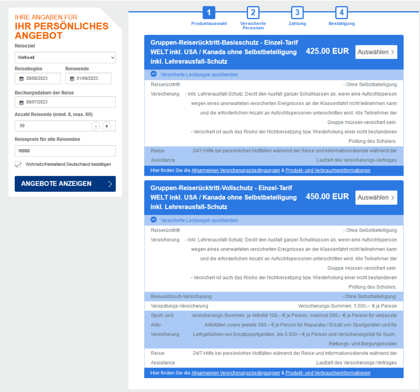
Ein Bild, das Text, Elektronik, Screenshot, Webseite enthält. Automatisch generierte Beschreibung